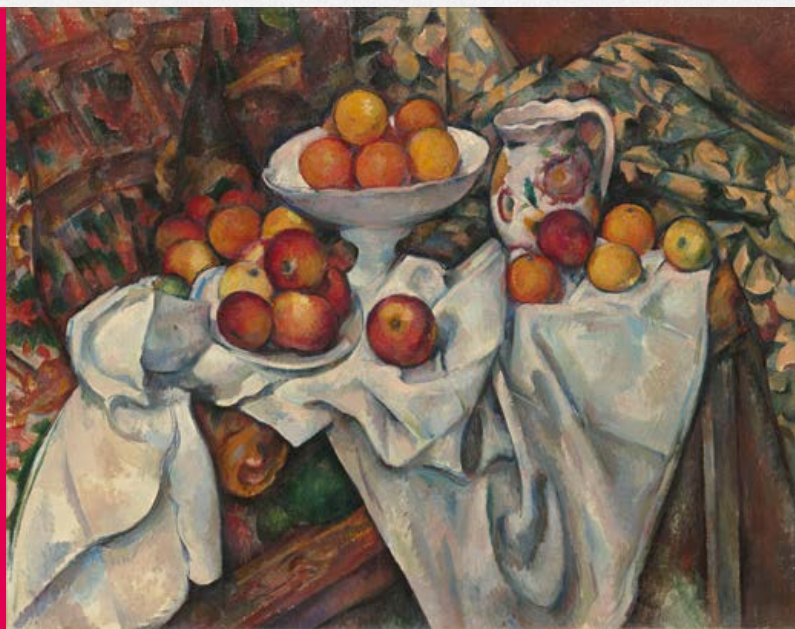
《りんごとオレンジ》 1899年頃 オルセー美術館