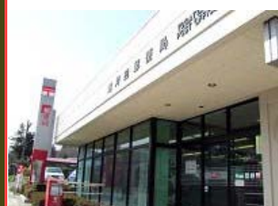
遠刈田温泉郵便局