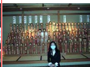
こけしと一緒に (笑)