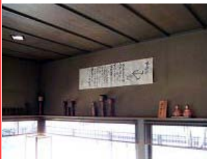
名産のこけしがたくさん