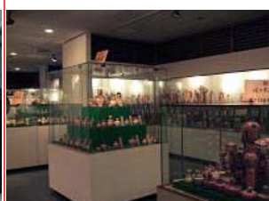
すっごい数のこけし