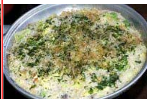
自然薯もんじゃ焼き