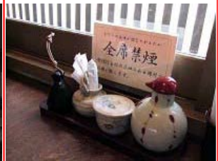
全席禁煙！素晴らしい！！