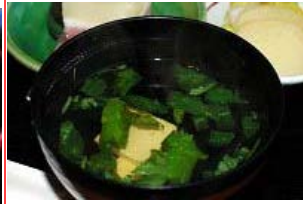
お吸物 (むかご入り)