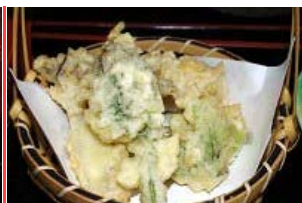
天婦羅 (拡大図は自然薯)