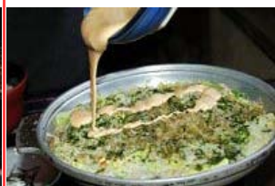
焼きあがったらタレをかけます