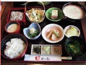
麦とろ蕎麦とろ膳