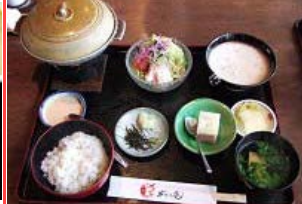
レディースセット