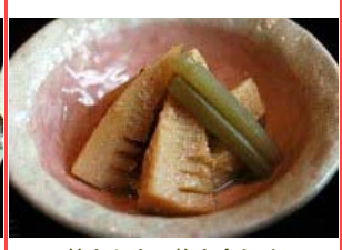
筍とふきの炊き合わせ